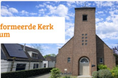
Gereformeerde Kerk Wilsom

Graag verwijzen we nogmaals naar onze (ver)nieuwe(de) website. U en jij kunnen daar altijd terecht in de zoektocht om specifieke informatie. Natuurlijk mag u en jij bij verdere informatie ook een klerkenraadslid benaderen.